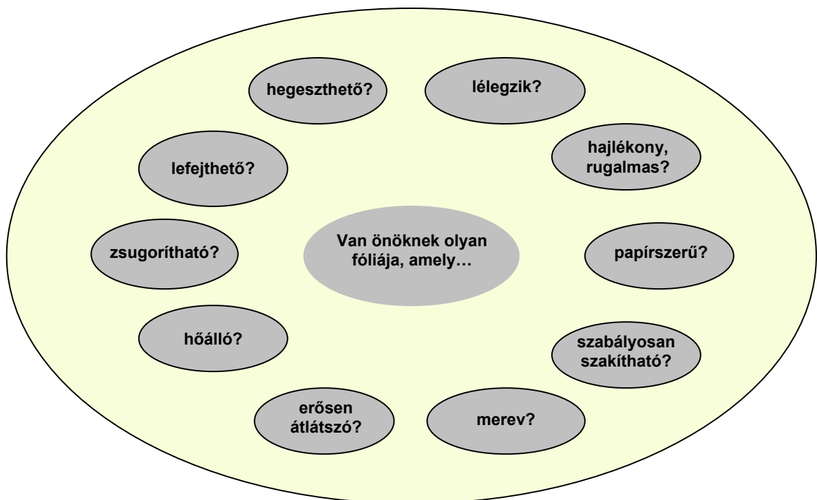
1. ábra A felhasználók gyakori kérdései a fóliagyártókhöz

A ma forgalmazott fóliák adatlapjai meglehetősen egyhangúak, nagyon általános tulajdonságokat adnak meg, speciális tulajdonságok legtöbbször nem is szerepelnek bennük. A megrendelő első kérdései is elég egyszerűek, nem derül ki belőlük, valójában mit is vár el a fóliától (1. ábra). A fóliagyártók erre kiképzett munkatársai vagy az alkalmazástechnikusok ilyenkor felveszik a kapcsolatot a megrendelővel, és megpróbálják kideríteni, hogy pontosan mire van szüksége, és tisztázzák a részleteket, hogy később a fóliával ne okozzanak csalódást. Ahhoz, hogy a fólia tulajdonságait a felhasználó maximálisan kihasználhassa, a gyártónak tudnia kell, hogy milyen célra fogják azt felhasználni.